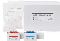
MycPrep Kit 결핵진단용