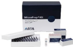
MycPrep Kit 미생물진단용