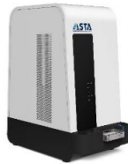
IDSys® Elite (Bench Top)