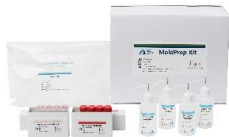
MoldPrep Kit 곰팡이균진단용